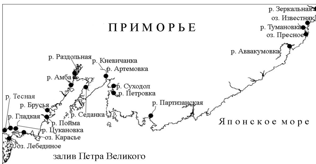
Рис. 1. Карта – схема района работ

Настоящая работа основана на материалах, собранных в различных водоемах Приморья с 2002 по 2006 гг. Места наблюдений показаны на рис. 1. Объем собранного материала представлен в таблице 1.