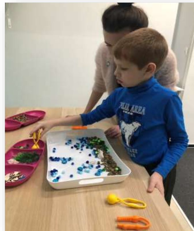
Творческое задание на мелкую моторику