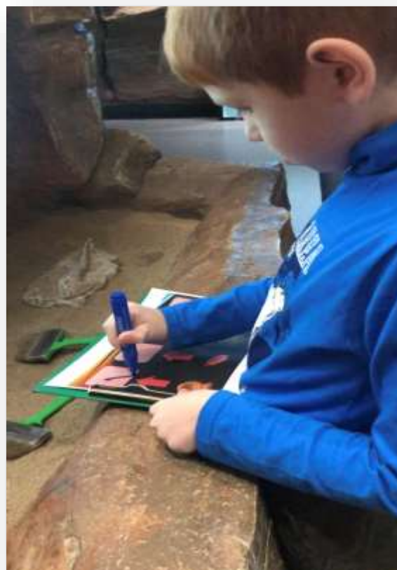
Задание «Найти и отметить»