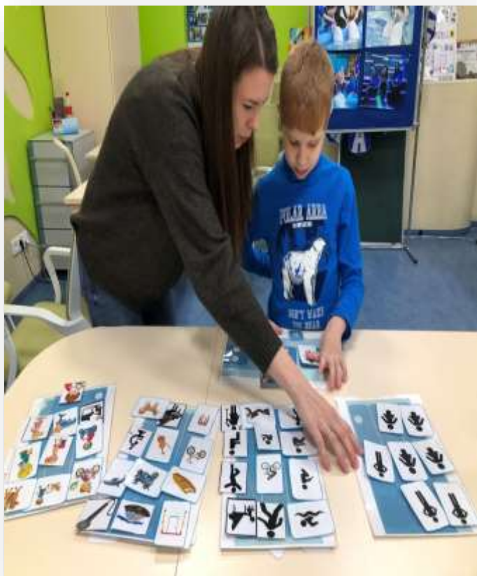
Использование визуальной поддержки