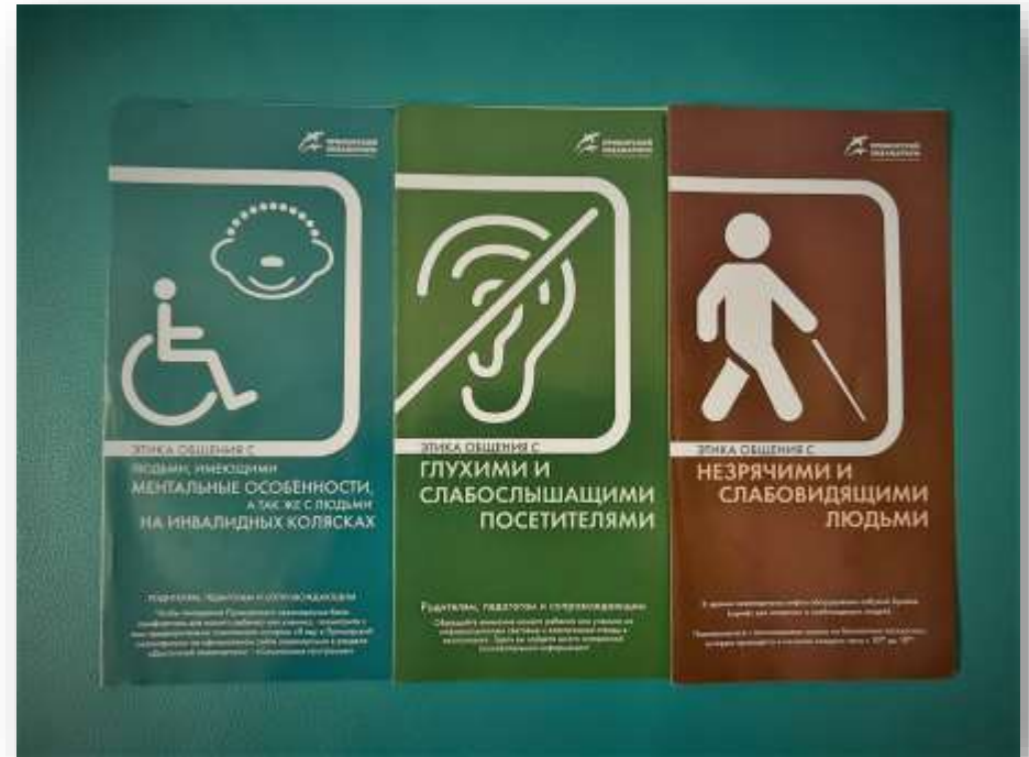
Информационные буклеты Приморского океанариума «Этика общения с людьми с ОВЗ»

Инклюзия - процесс включения людей с особыми потребностями в активную общественную жизнь через создание для них адаптированной среды и оказание поддерживающих услуг.