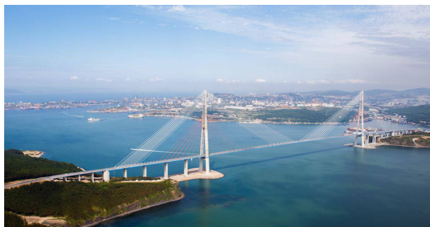
Мост на о-в Русский

Владивосток является крупным культурным центром Дальнего Востока. Самым известным музеем Владивостока считается Приморский государственный объединённый музей имени В. К. Арсеньева, ведущий свою историю от музея Общества изучения Амурского края. Большой интерес представляют два океанариума (Приморский океанариум планируется к открытию в июне 2016 г. на о-ве Русском), подводная лодка-музей С-56 и другие, в частности, Научно-учебный музей ДВФУ, Приморская краевая картинная галерея, музеи ин-тов ФАНО. В городе имеется 7 театров, в том числе открытый в 2013 г. Приморский театр оперы и балета, цирк, 8 кинотеатров. Центр города представляет архитектурную жемчужину, где вдоль улицы Светланской протянулись здания второй половины 19-го века, многие из которых были построены иностранными предпринимателями. Достопримечательностями города также являются мосты через бухту Золотой Рог и пролив Босфор Восточный, фуникулер, здания кирпичи, железнодорожный вокзал.