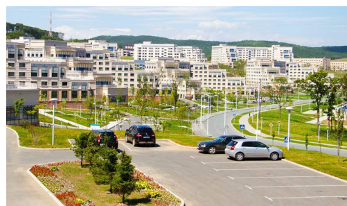
Кампус ДВФУ на о-ве Русском