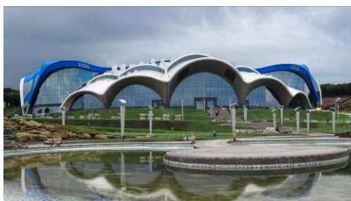
Приморский океанариум на –ве Русском

Владивосток – самый крупный город Дальнего Востока России с населением более 600.000 жителей. Владивостокский городской округ занимает территорию полуострова Муравьев-Амурского, около 50 островов залива Петра Великого (среди которых только 6 имеют площадь свыше одного квадратного километра: Русский, Попова, Рейнеке, Рикорда, Шкота, Елены). Крупный о-в Русский связан мостом с материковой территорией. Город протянулся на расстояние около 30 км с юга на север, омывается водами Амурского и Уссурийского заливов, входящих в акваторию залива Петра Великого Японского моря.