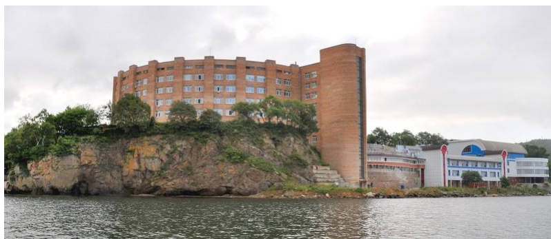
Национальный научный центр морской биологии ДВО РАН

Владивосток – крупнейший научно-образовательный центр дальневосточного региона, включающий Дальневосточный федеральный университет, Дальневосточное отделение РАН и многочисленные институты Федерального агентства научных организаций (ФАНО). Другими крупными научными организациями является Тихоокеанский научно-исследовательский рыбохозяйственный центр (ТИНРО-Центр) и Дальневосточный региональный научно-исследовательский гидрометеорологический институт (ФГБУ «ДВНИГМИ», Росгидромет). Общество изучения Амурского края (ОИАК), старейшая дальневосточная научная организация, сохранив своё название, функционирует теперь как Приморское краевое отделение Русского географического общества.