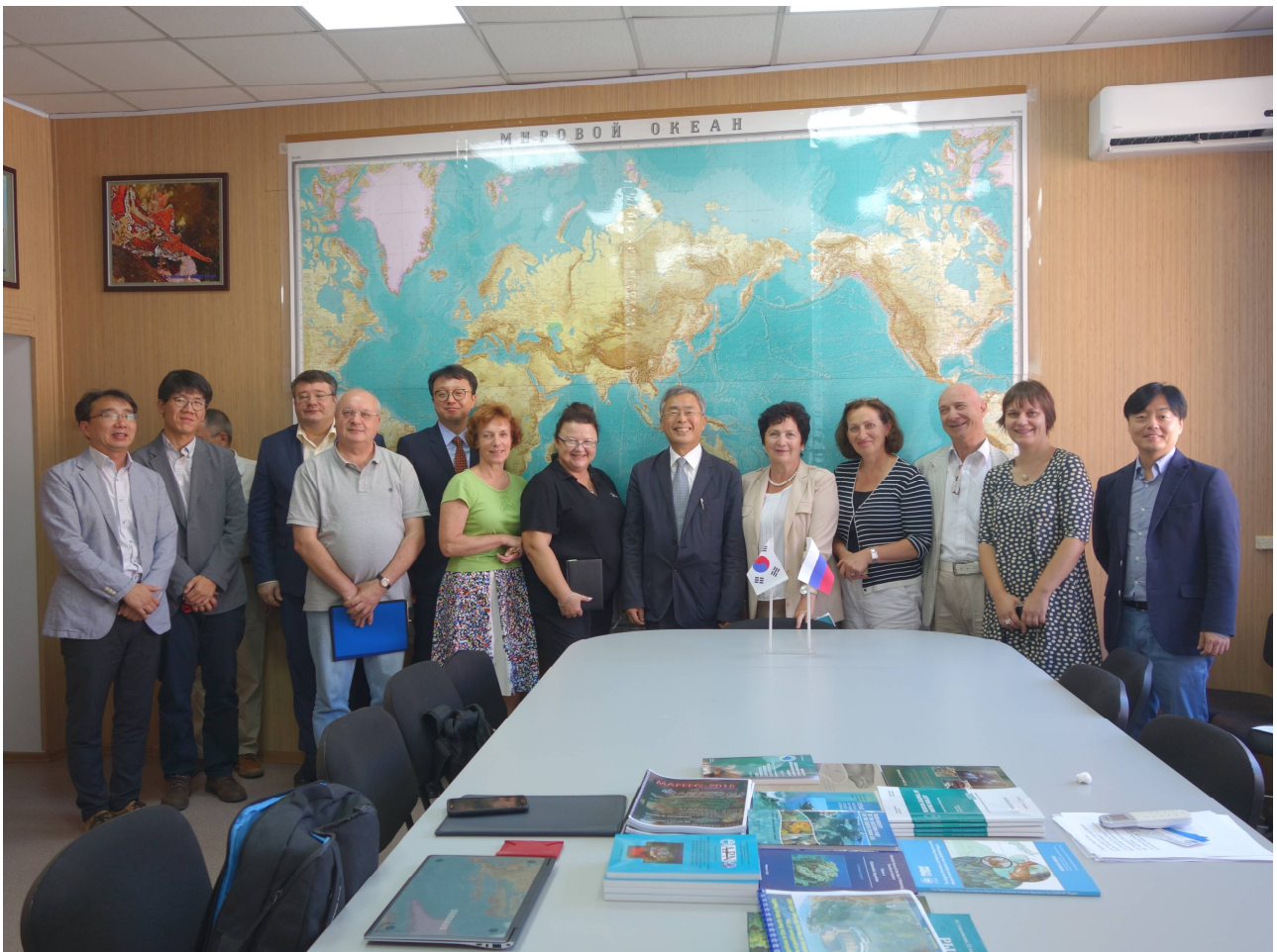
Участники семинара в ИБМ ДВО РАН