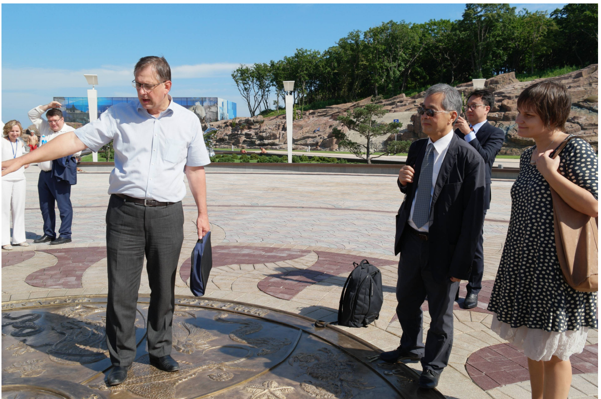
Посещение Приморского океанариума