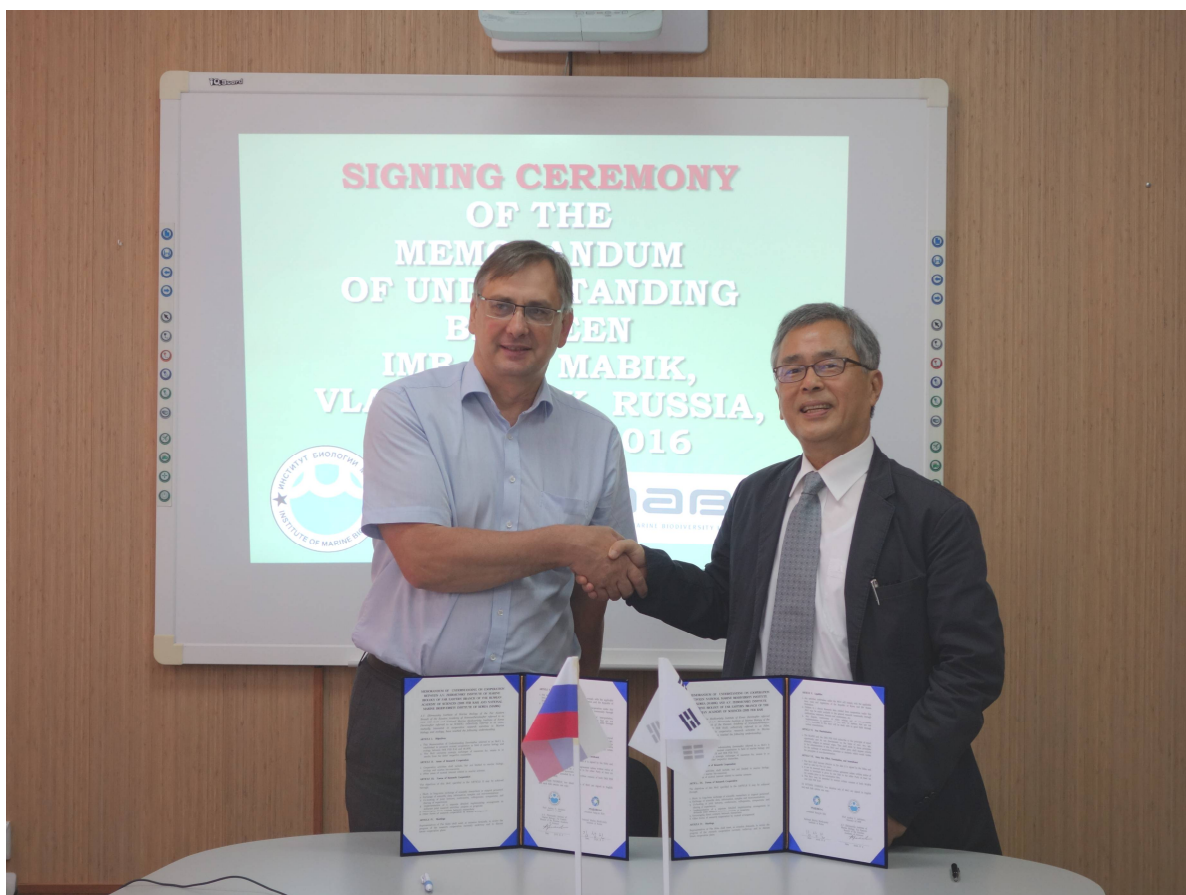
Подписание меморандума между ИБМ ДВО РАН и МАБИК