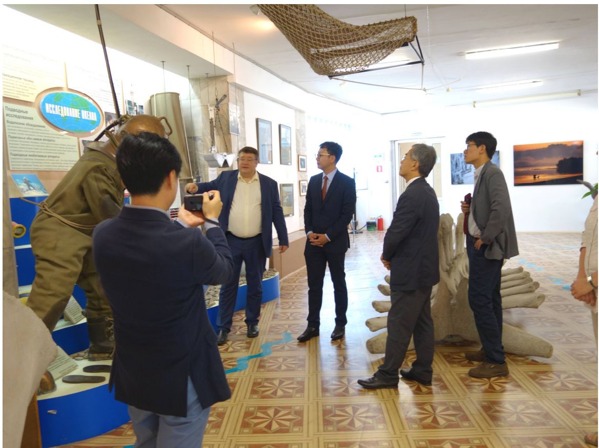
В Музее ИБМ ДВО РАН