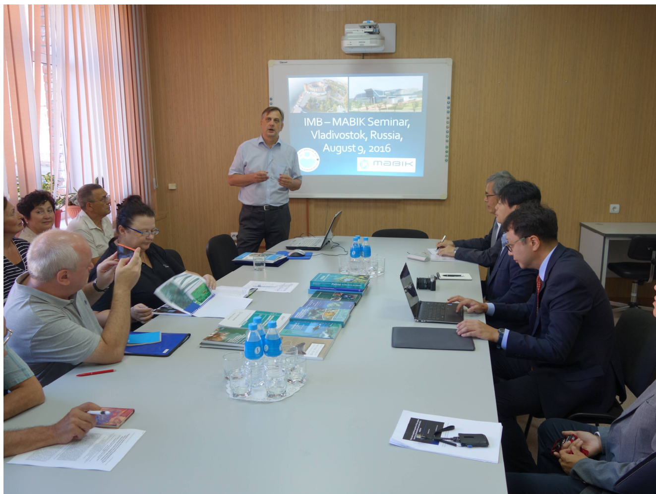
Семинар в ИБМ ДВО РАН (выступает акад. А.В. Адрианов)