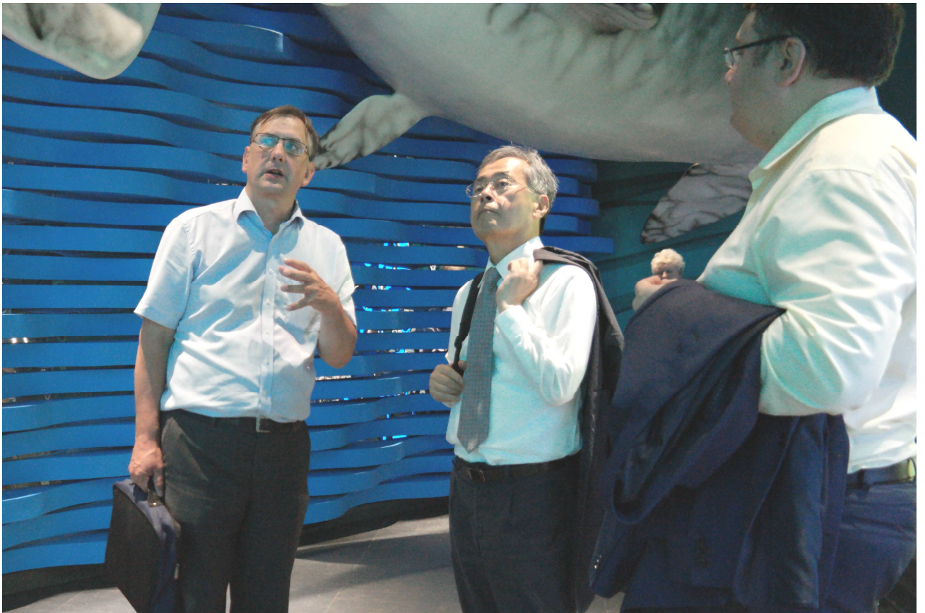
Посещение Приморского океанариума