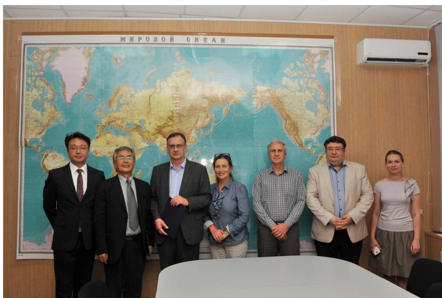
Коллективная фотография участников переговоров

аналогичным образом предоставит лабораторное пространство в принадлежащих ему зданиях, оба учреждения организуют административно-офисное обслуживание приезжающих сотрудников. Основным меморандумом предусмотрено использование оборудования, библиотеки и иных ресурсов сотрудниками обоих учреждений на взаимовыгодной основе. Будет создан Комитет совместной лаборатории из 6 членов, который определит стратегию исследований, разработает планы работ и согласует их с администрациями институтов, в комитет войдут руководители обоих учреждений и два со-директора лаборатории. Лаборатория будет действовать до 31 декабря 2020 г., и в случае успешной работы, комитет и администрации ин-тов предложат в декабре 2020 г. продлить соглашение.